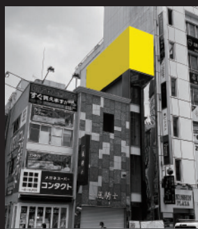
オークリストア渋谷前から