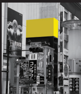
ヤマダ電機LABI渋谷前から