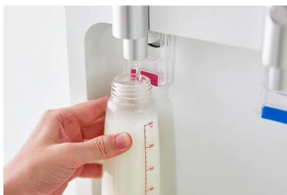
ウォーターサーバー様