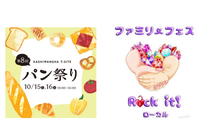
イベント主催者様