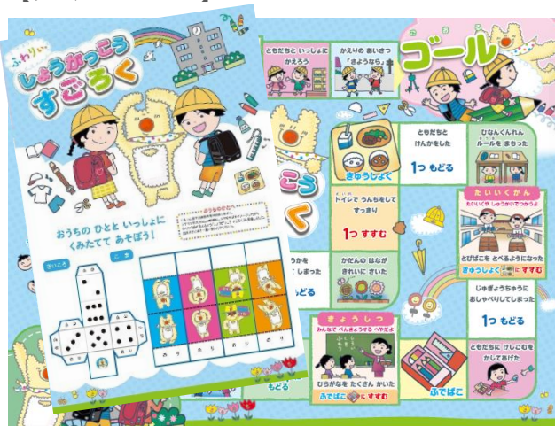
【ランドセルメーカー】