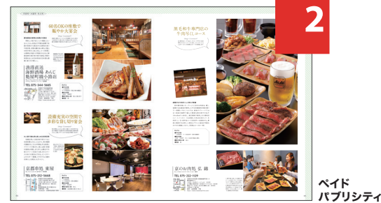
ペイドパブリシティ