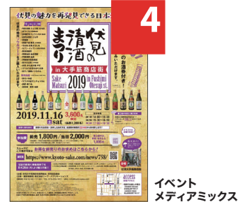
イベントメディアミックス