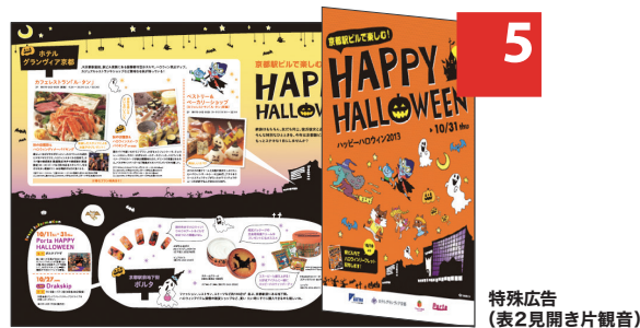
特殊広告 (表2見開き片観音)

雑誌の中で考えられる、あらゆる広告手法に対応できます(中綴じ、観音開き、片観音など)