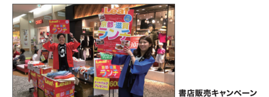
書店販売キャンペーン