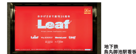
地下鉄鳥丸御池駅看板