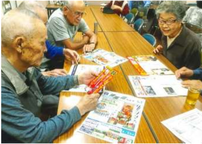
配布された広報紙とチラシを見る老人クラブ会員（福岡市博多区）

【ここがポイント】 折込チラシは広報紙の「p2～p3」に挟み込まれます。読もうとすると必然的に読者の目に触れます。