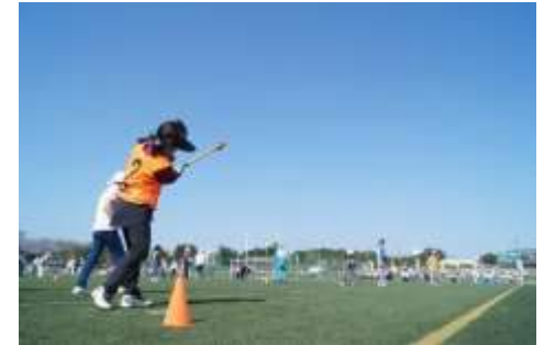
グラウンド・ゴルフ大会

(右上：府中市、右下：東久留米市、 左下：中野区、いずれも東京都内の 実際の老人クラブ活動)