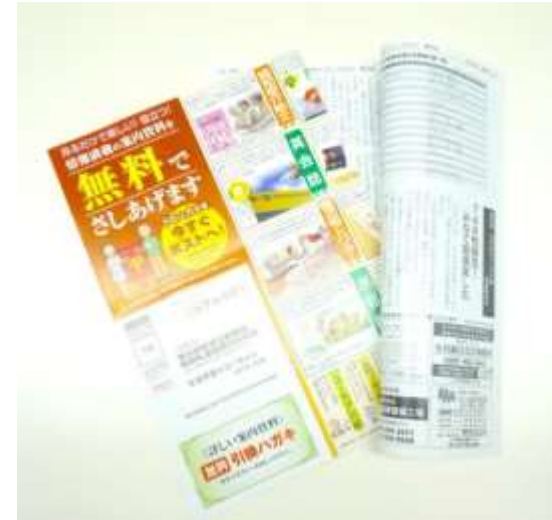
「ページを開くとすぐ目に触れる」ことで他媒体と差別化しています。