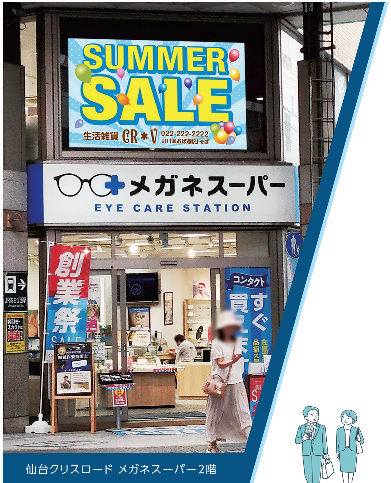
仙台クリスロード メガネスーパー2階