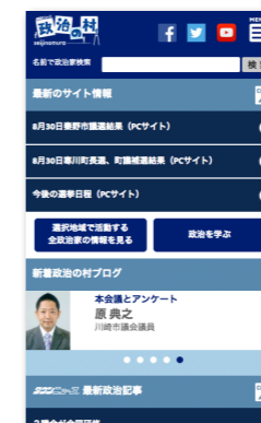
スマートフォン表示