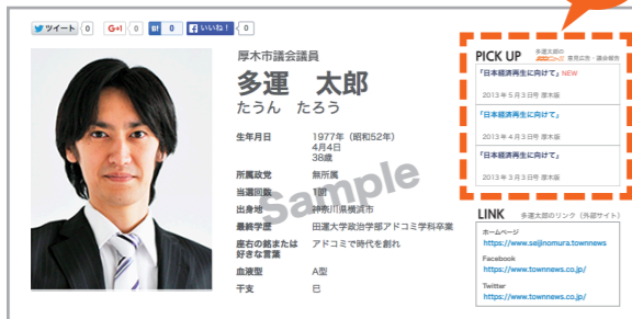
個人ページ（無料）見本