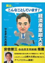
山際大志郎 衆議院議員 「実は、こんなことしています！ 経済産業副大臣」