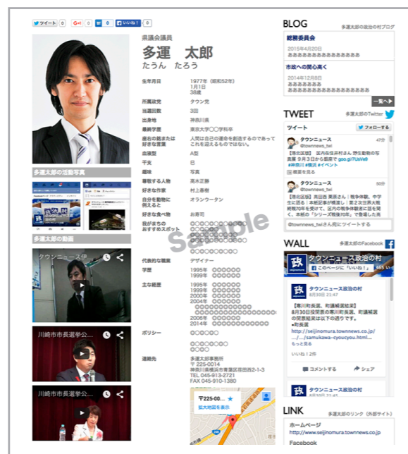
個人ページ（有料）見本

個人のページを、年間12万円（税別）で機能強化する事が可能です。詳細なプロフィールを掲載でき、ブログも書けるのでホームページの代わりにする事も可能。政治活動や政策をもっと具体的にスピーディーに伝えられます。また、すでにある自身のホームページやブログへ閲覧者を誘導する事も可能です。