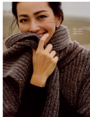
RINA 本誌4ページ以上。出演費+30