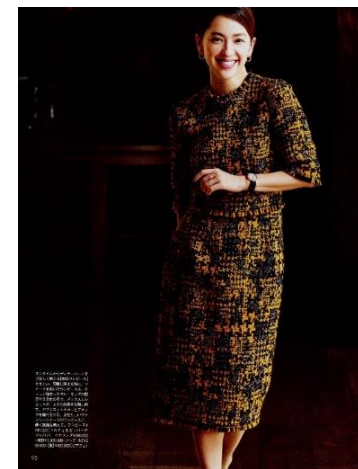
中村アン 本誌4ページ以上。出演費+60