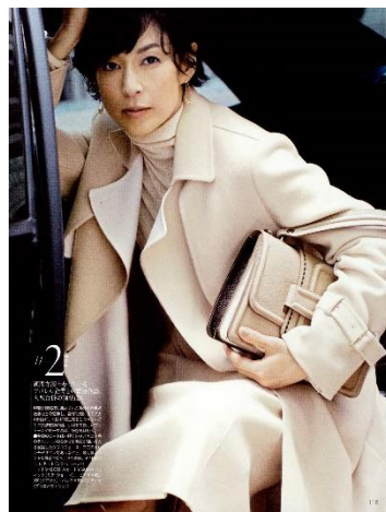
鈴木保奈美 本誌6ページ以上。出演費+50