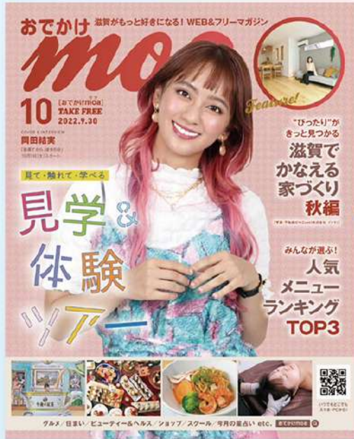
フリーマガジン/電子ブック ※2022年10月号