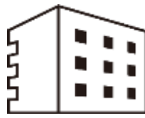
メディバンクス社