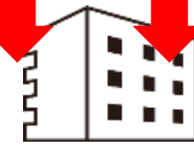
メディバンクス社

参加専門学校にサンプル着日から2週間程度後にFAXにてアンケートを送付。 任意でアンケート・配布写真弊社にご返信頂きますので、配布状況が明確になります。